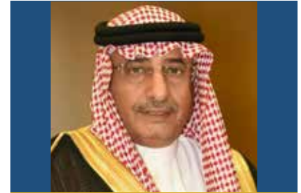
أ.د. فلاح بن فرج السبيعي معالي رئيس الجامعة

تواصل الجامعة من خلال الملتقى الأول للفرص الاستثمارية بالمدينة الجامعية 2020 مد جسور التعاون مع المجتمع، حيث هيأت كافة إمكاناتها لخدمة الوطن؛ فعمدت الجامعة الكثير من الشراكات مع مختلف الجهات الحكومية والخاصة، ونفذت العديد من الدورات التدريبية التطويرية لأبناء وبنات المنطقة، كل ذلك يأتي حرصاً على احتياجات جميع شرائح المجتمع والعمل على التدريب والتطوير بما يسهم في تنمية مهاراتهم وتثقيفهم.