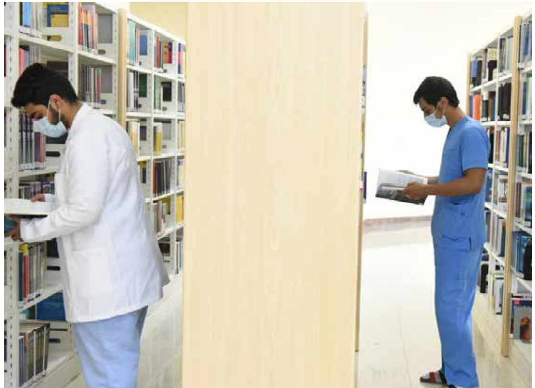
طلاب من الكليات الصحية يطالعون بعض الكتب الطبية في مكتبة الأمير مشعل بن عبدالله المركزية بالجامعة