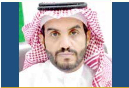
د. زهير العمري وكيل الجامعة

أوضح وكيل الجامعة د. زهير العمري أن تنظيم الجامعة للملتقى الأول للفرص الاستثمارية بمشاركة القطاع الخاص كأحدى الخطوات التي تنتهجها الجامعة في اطلاع رجال الأعمال على الفرص الاستثمارية الواعدة في الجامعة وطرحها أمام المستثمرين لتنويع مصادر الدخل، حيث تحرص في تنمية الموارد الاستثمارية للجامعة وفق أفضل الممارسات المحلية والدولية.